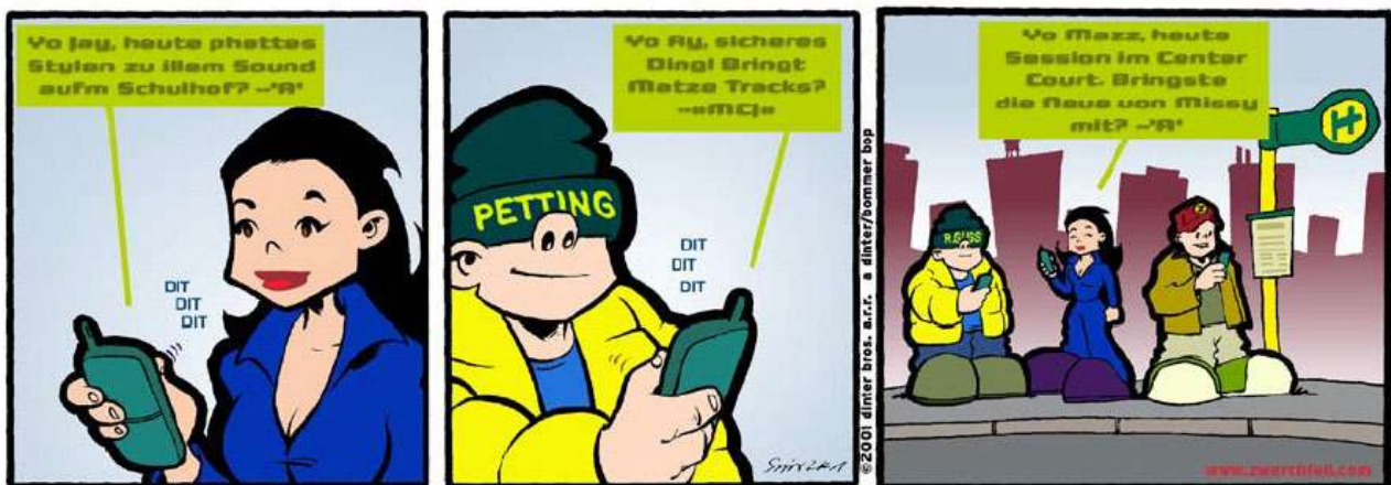
Abbildung aus: »dinter & bommer«, © 2001 dinter bros. a.r.v.