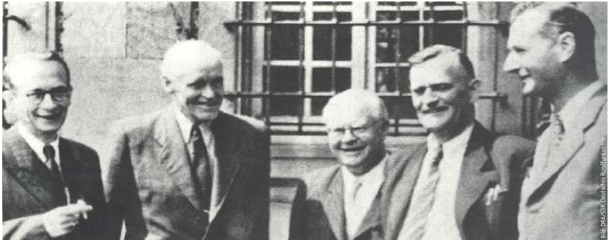
Konstituierung der ARD in München