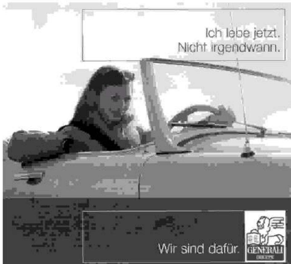
Abbildung 10, aus: News, 2. Mai 2002, S. 41.

Der Zwang zu hohen Impact-Werten bringt also gerade die Werbung dazu, aktuelle Normen in Frage zu stellen, wie die Benetton-Kampagnen der neunziger Jahre