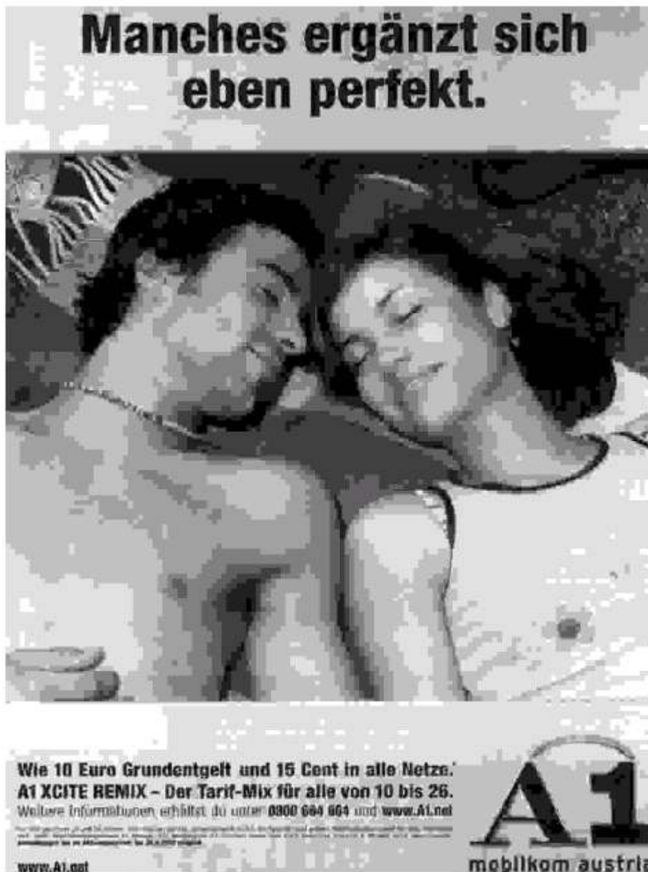
Abbildung 8, aus: E Media, 19. August 2002, S. 118.