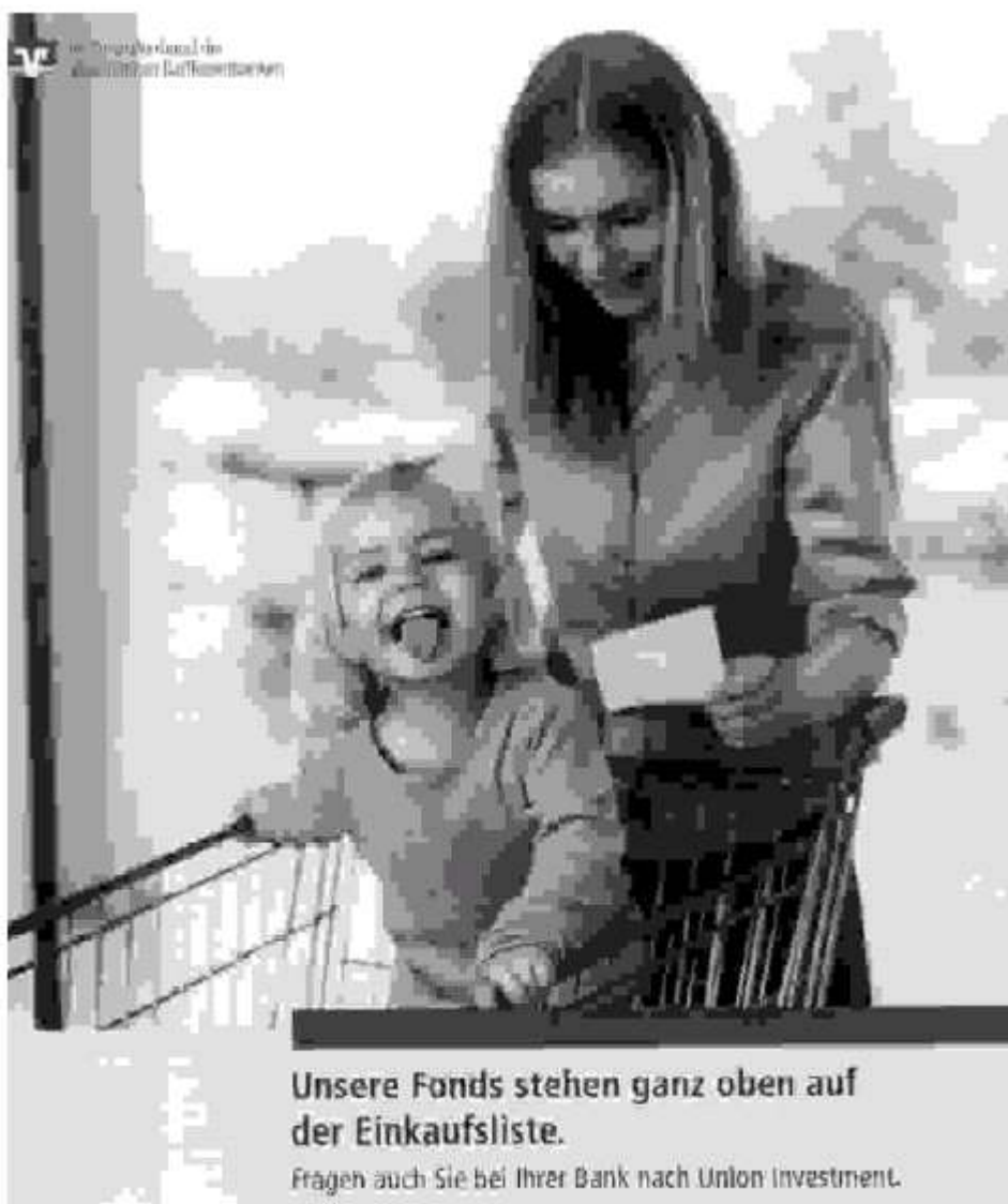
Abbildung 3, aus: Business People 6, Juli/Aug. 2002, S. 227.