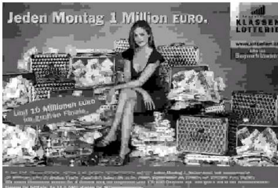
Abbildung 1, aus: News, 2. Mai 2002, S. 189