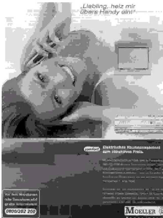
Abbildung 2, aus: News, 2. Mai 2002, S. 124.

(Abb. 2). Das per Fernbedienung ferngesteuerte Haus als technologische Innovation genügt offenbar nicht als Anreiz für eine ohnedies technikorientierte männliche Käufergruppe, sondern muss noch mittels einer eindeutigen Aufforderung seitens der im Haus anwesenden Frau verstärkt werden. Die Frau ist scheinbar nicht imstande, die Geräte selbst zu bedienen, sondern sieht sich genötigt, dazu den Mann per Handy aufzufordern. Auch dieses Sujet, das die Technikfeindlichkeit der Frau zudem mit dem Bild der müßigen Hausfrau verknüpft, die sich vormittags noch im Bett räkelt und von ihrem vermutlich im Büro arbeitenden Mann träumt, hat vermutlich niemanden zu einer frauenfeindlichen Darstellung bewegt.