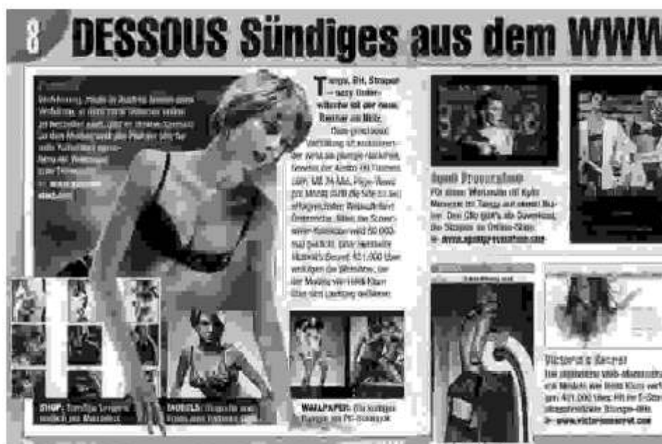
Abbildung 7, aus: E Media, 19. August 2002, S. 24.