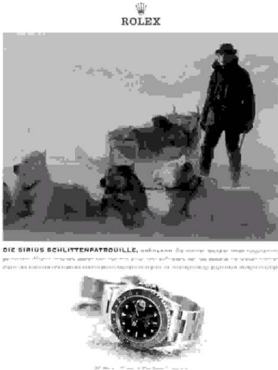
Abbildung 9

Er ist stets auf sich gestellt, muss Entscheidungen alleine treffen und trägt die Verantwortung für sich und seine Umgebung, sei es das Wohl der Firma, der Untergebenen, der Familie oder, wie in diesem Beispiel, das Überleben der